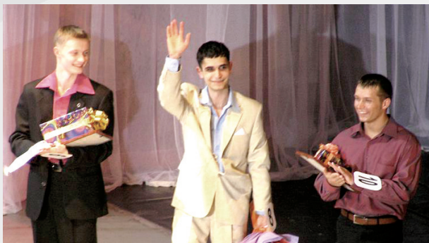
Победители конкурса «Студент года»

Образовательная программа позволяет наряду с универсальной базовой подготовкой получить компетенции и в новых наиболее востребованных областях управления организацией. С 1-го курса студенты погружаются в профессию. Этому способствует целый комплекс интерактивных методов обучения, практики в наиболее перспективных и инновационных бизнес-процессах организаций (проекты для Группы ВТБ, исследовательские и бизнес-проекты на муниципальном и региональном уровнях). «Неделя менеджера», бизнес-игры и тренинги, практика и стажировка в ведущих компаниях региона дают нашим студентам возможность уже на этапе получения образования раскрыть свой потенциал и привлечь к себе внимание потенциальных работодателей.